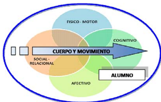
Figura 1: La Educación Física en el desarrollo humano (Adaptado de Gómez Rijo et al. 2008)

El objetivo de este trabajo es exponer la experiencia y los resultados obtenidos al utilizar el fútbol como herramienta para el trabajo de los valores y actitudes en la E.S.O. según las Competencias Básicas.